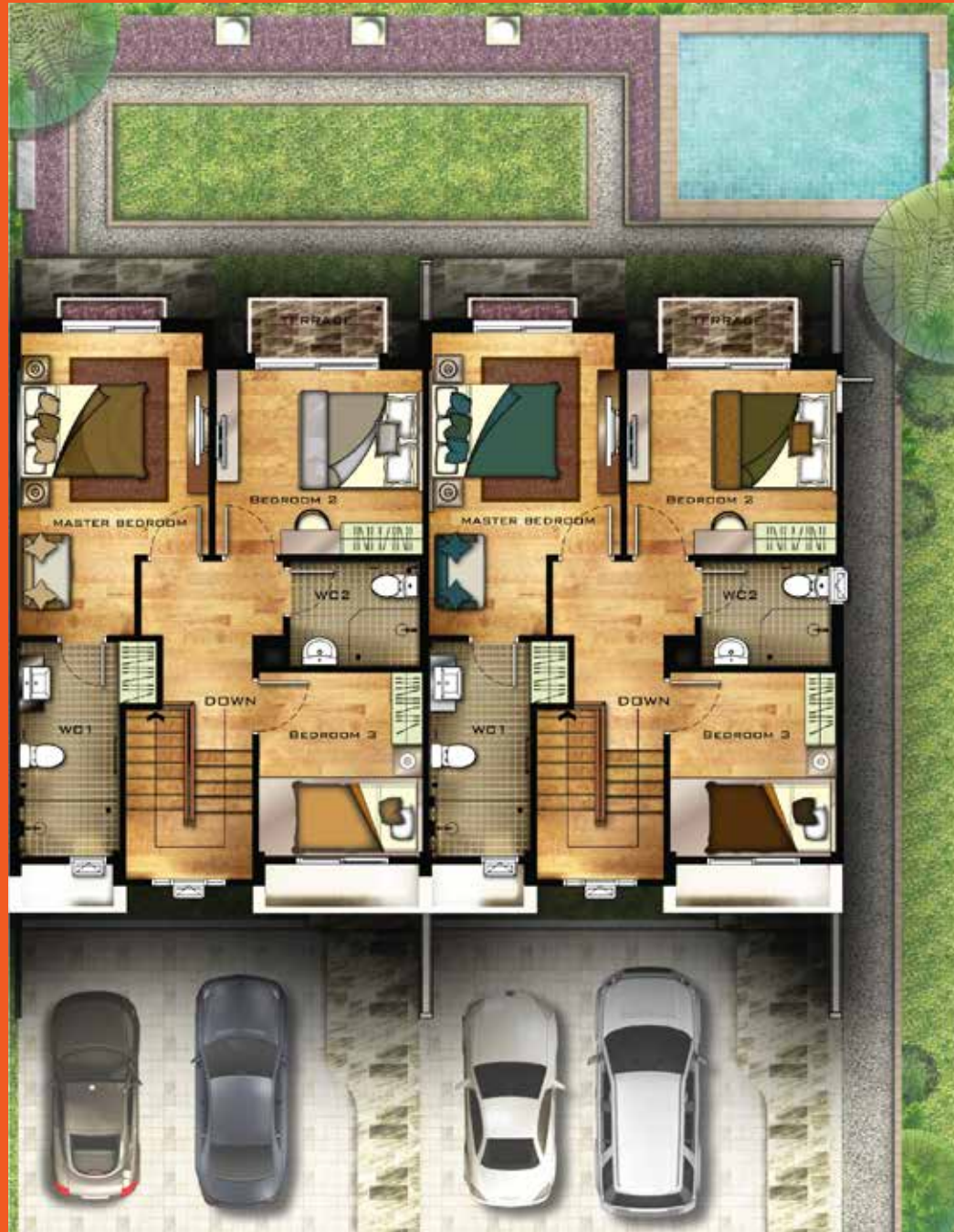
2 nd FLOOR PLAN