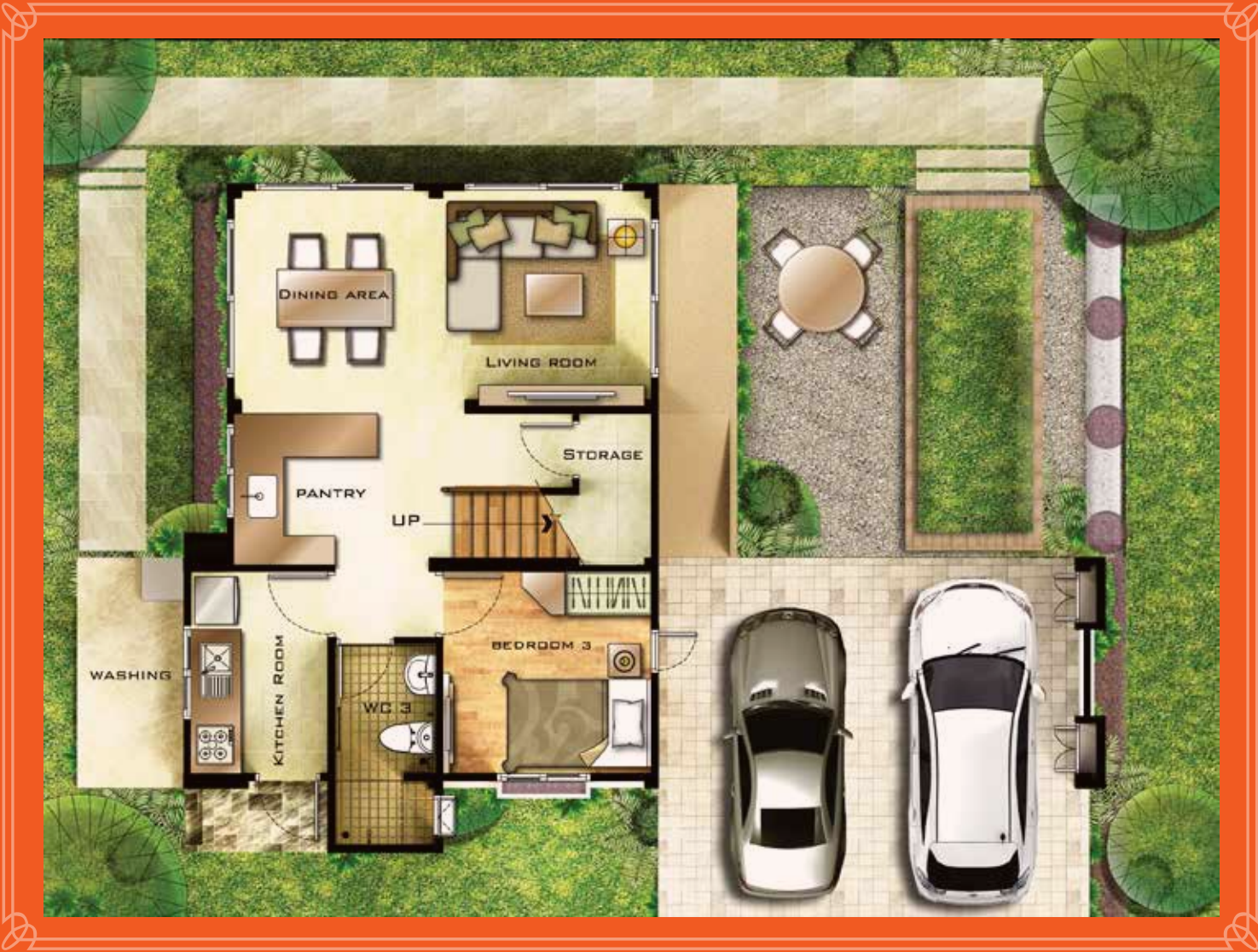
1 st FLOOR PLAN