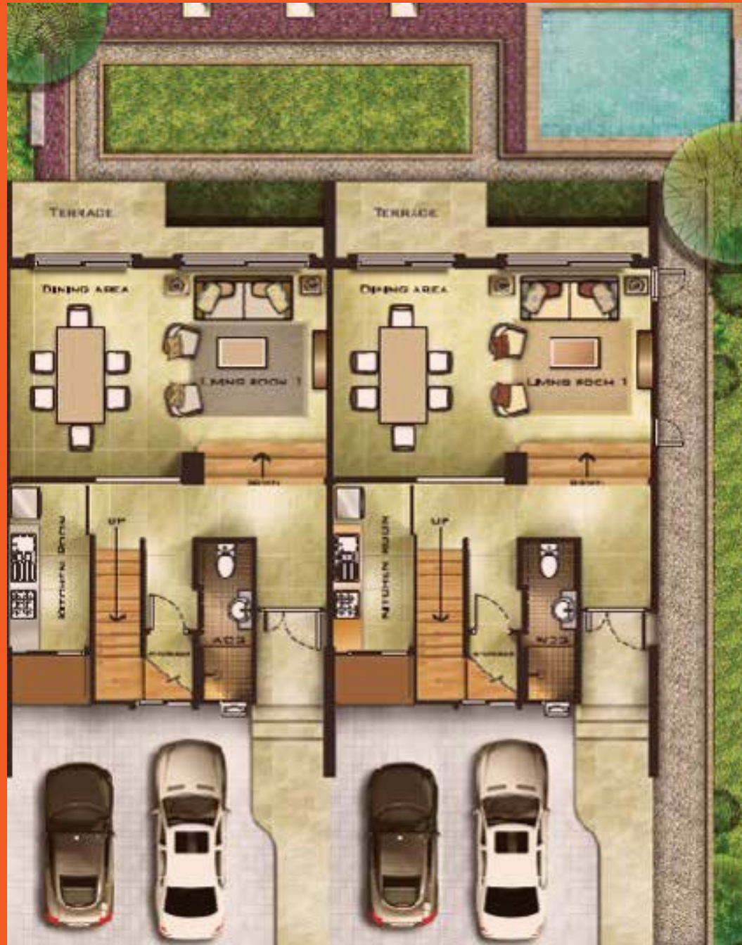
1 ST FLOOR PLAN