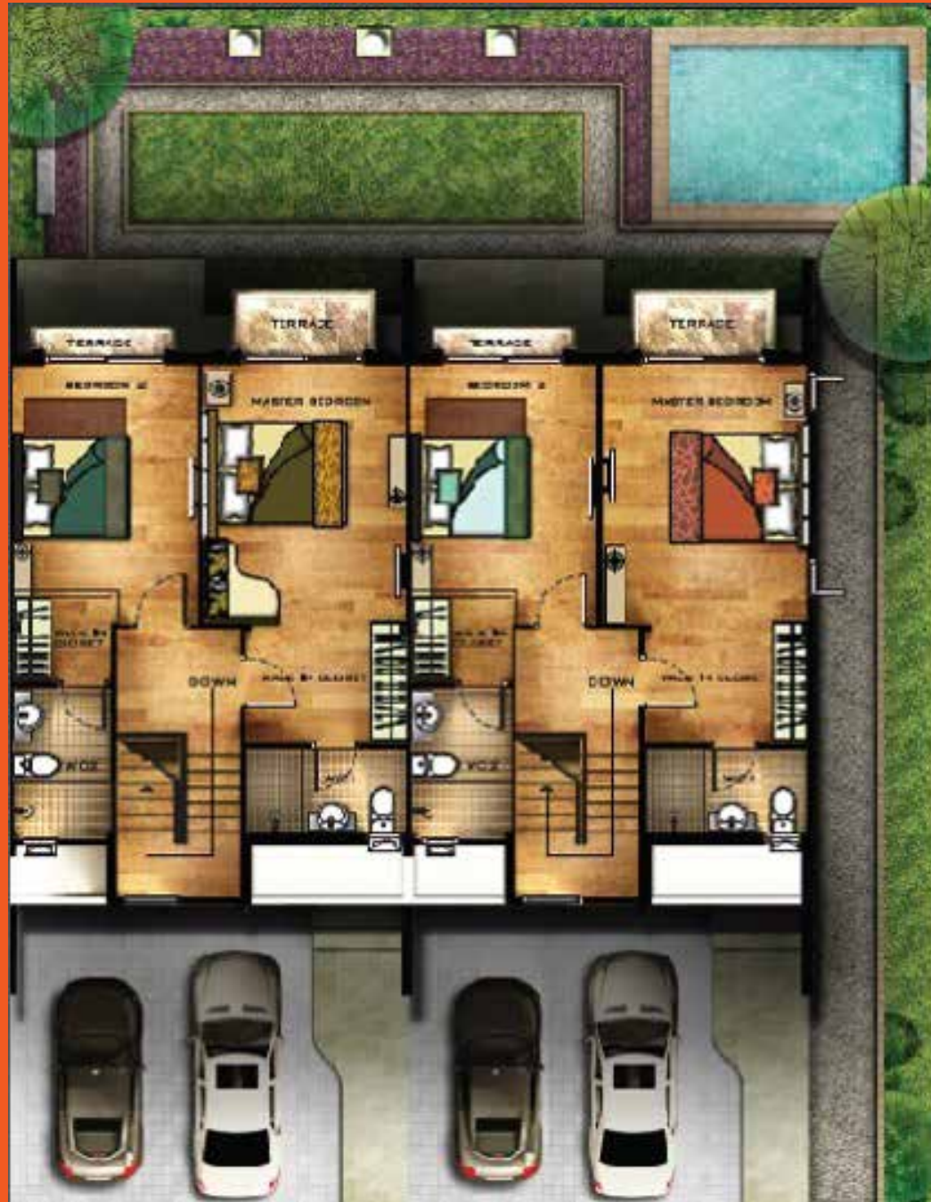
2 nd FLOOR PLAN