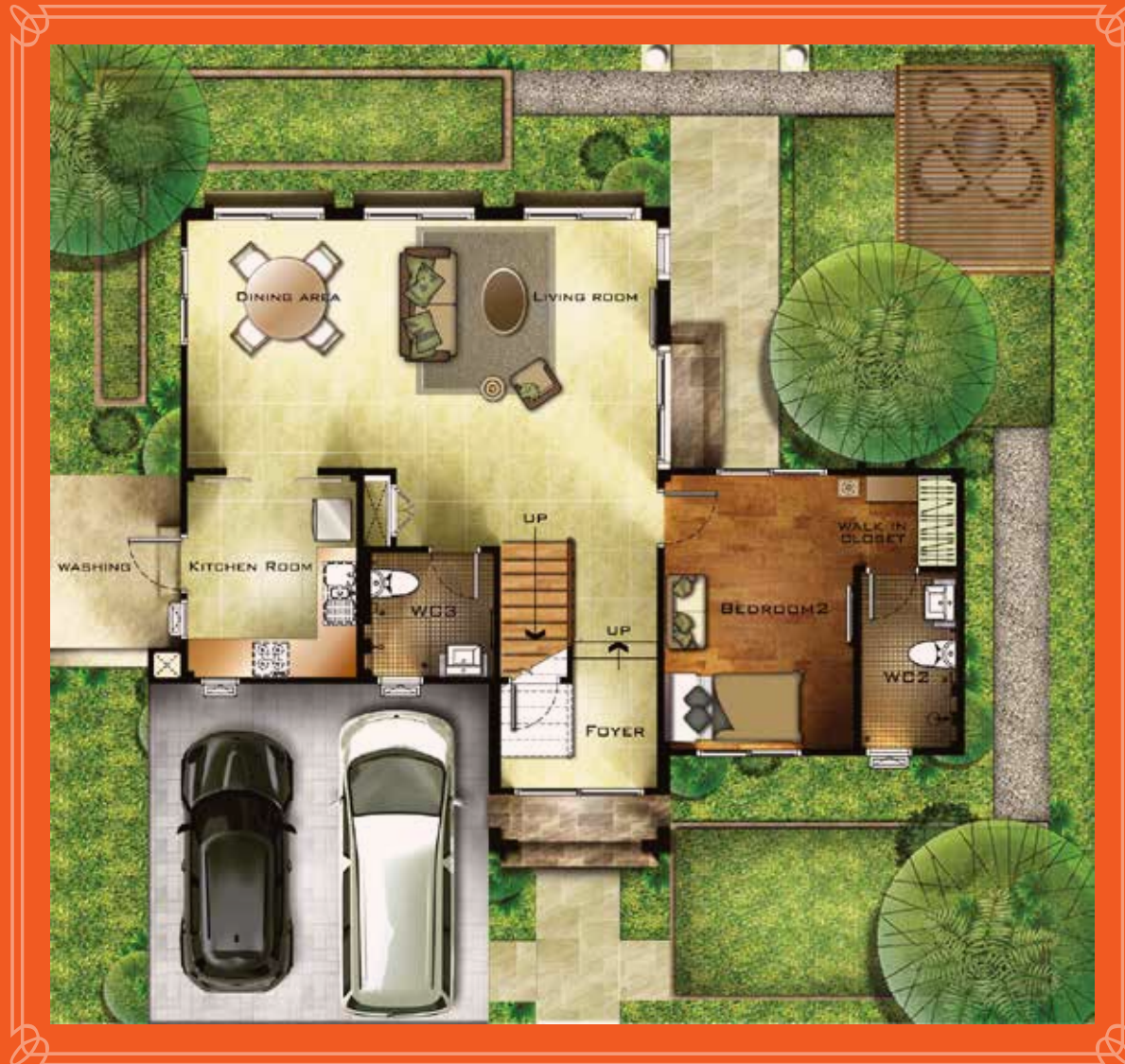
1 st FLOOR PLAN