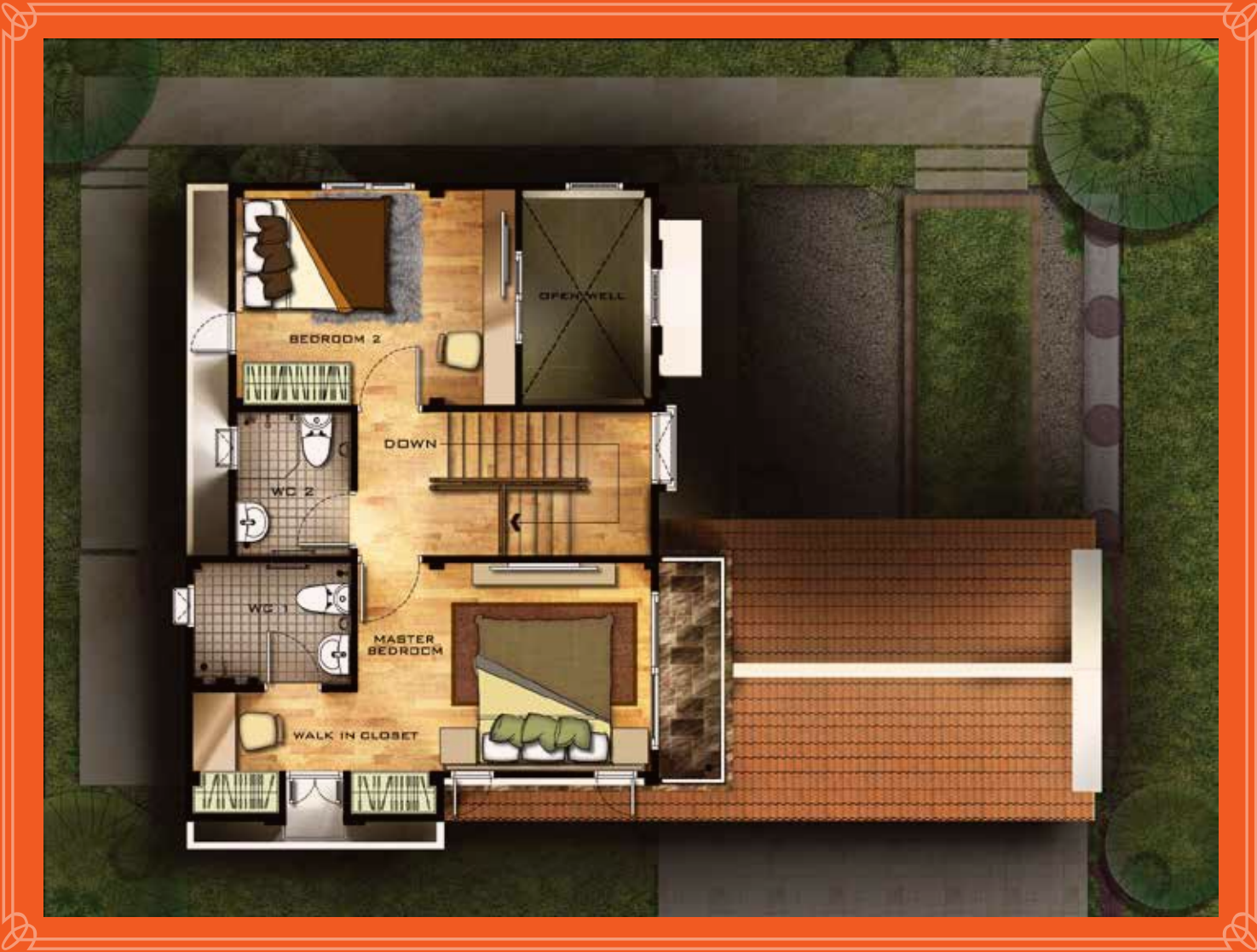
2 nd FLOOR PLAN