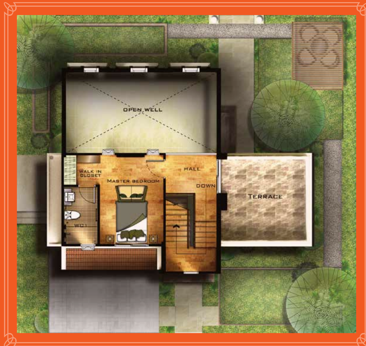
2 nd FLOOR PLAN