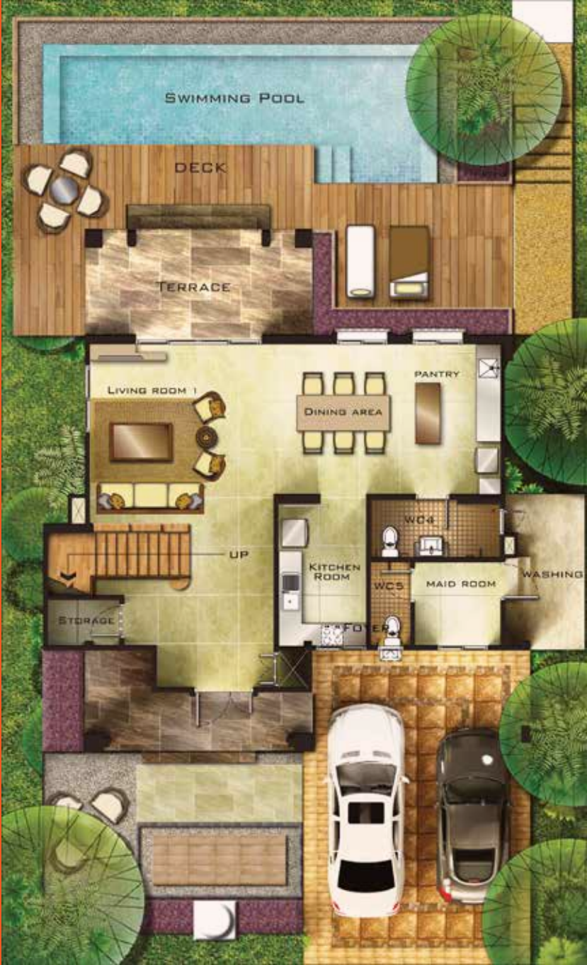
1 st FLOOR PLAN